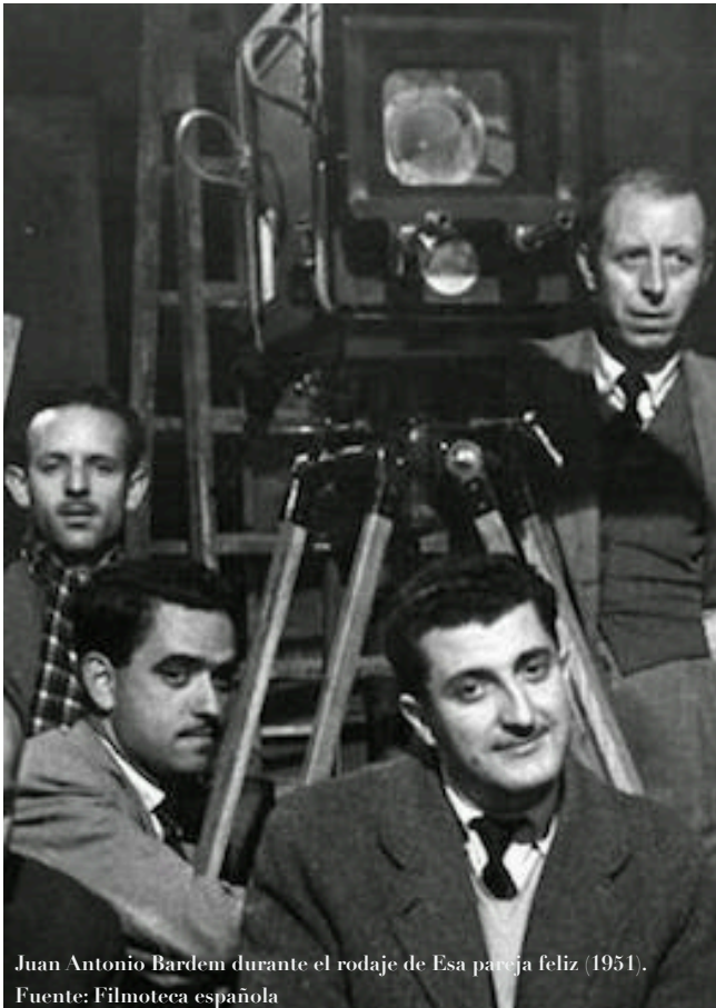
Juan Antonio Bardem durante el rodaje de Esa pareja feliz (1951).

Este encuentro pretende que profesores y estudiantes reflexionen sobre el poder del humor como herramienta de inmersión cultural y lingüística, con el fin de disfrutar de la dimensión más festiva, lúdica y crítica del hispanismo.