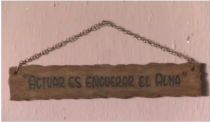
Fig. 1: Tabla de madera en el departamento de Flavia

“Actuar es como encuearar el alma”. 10 Hacia el final encontramos en el departamento de Flavia esta misma frase grabada en una pequeña tabla de madera, colgada en la pared a modo de aforismo (véase imagen 1). Con esta frase la película parece articular, por un lado, su disentimiento con juicios morales sobre de la prostitución y por otro, alude a los límites imprecisos entre puesta en escena (“actuar”) y autenticidad (“encuearar”) – a la que volveré en el apartado 4.