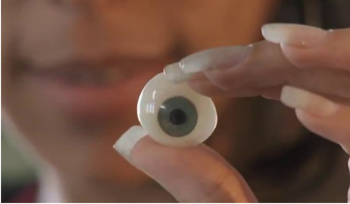
Fig. 10: Flavia enseña un ojo de vidrio a Ana

(véase imagen 9). Es decir, ella “contrafilma” (“films back”), encuadrando a los hombres europeos con el lente de su cámara imaginaria, lo cual articula su respuesta tanto en términos de género como de postcolonialidad, pero al mismo tiempo da claves también para el último tema que es el de hacer cine en Cuba.