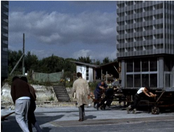
Abb. 1: Das terrain vague hinter dem Nicht-Ort in COURS DU SOIR (27:17)

zösischen Filmkomödie mit kaum noch überbietbarer Konsequenz erprobt: der Komiker, Filmemacher und Filmstadtgründer Jacques Tati.