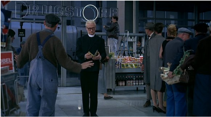
Abb. 5: Der Nimbus des belebten Drugstore in PLAYTIME (1:52:28)

tätigkeit 27 . Dies gilt sowohl im Hinblick auf die Handlung vor der Kamera als auch und vor allem für die Kamerahandlung selbst 28 . Schon auf Handlungsebene wird mehrmals eine aus „Tativille“ fast vollständig verbannte bunte und krumme Welt dank unwillkürlicher Eingriffe des Helden wiederhergestellt. Zum ersten Mal geschieht dies in der Ausstellungshalle, wo Hulot auf Bitte zweier Besucherinnen eine zum Sortiment gehörige Lampe namens „Lustro“ einschaltet (Abb. 4). Plötzlich öffnet sich im klinischen Intérieur ein kleiner Rotlichtbezirk, der umso indezenter wirkt, als kurz zuvor ein Elektrobesen mit grellen Suchscheinwerfern als Nonplusultra restlosen Reinemachens vorgeführt wurde. Vor allem aber bei seinem Besuch im „Royal Garden“ bringt Hulot kreativen Schwung ins Geschehen. Nicht genug damit, dass er beim Eintritt die Glastür zertrümmert, die der Portier fortan pantomimisch vorgaukeln muss. Später reißt er versehentlich einen Teil der Deckenverblendung herunter und schafft damit eine kleine Bühne neben der Bühne. Darauf beginnen einige Gäste Koch und Kellner zu spielen, so dass inmitten des abstrakten Restaurants ein Pariser Bistro entsteht. So übernimmt der hereingeschneite Hulot ungewollt die Rolle des Architekten, der bei der Eröffnung des „Royal Garden“ anwesend ist; nicht von ungefähr wird ihm feierlich dessen Meterstab überreicht.