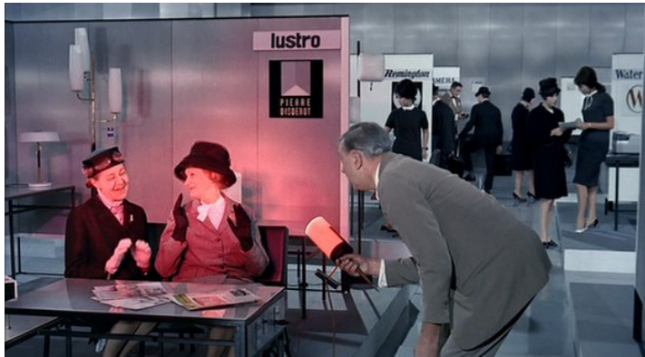
Abb. 4: Der momentane Rotlichtbezirk in PLAYTIME (41:05)

wirkt er hier vorwiegend wie ein Spielball seiner Umgebung. Hinzu kommt, dass die für das Stadtviertel kennzeichnende Serialität sozusagen auch auf ihn selbst übergreift. Schon in Orly und erst recht in „Tatville“ treten immer wieder Doppelgänger des Helden in Szene, die man oft erst auf den zweiten Blick als solche erkennt. Tatis ehrenwertes Bestreben, in PLAYTIME die Gags nicht mehr dem Helden vorzubehalten, sondern an verschiedene Figuren zu delegieren und dadurch die Komik zu demokratisieren, wirkt in erster Linie dem abstrakten Schauplatz geschuldet 26 . An einem dermaßen glatten und gleichförmigen Nicht-Ort, so scheint es, scheitert früher oder später jeder Benutzer – wobei das Scheitern stets im Zeichen unpersönlicher Situationskomik steht.