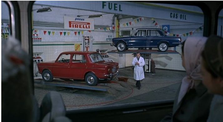
Abb. 9: Die Autowerkstatt als Fahrgeschäft in PLAYTIME (2:01:15)

zeuge kommt zum einen schon in der Szenerie selbst zustande. Ein Citroën 2 cv lässt seine hydraulische Federung spielen; auf dem Rücksitz eines Motorrads führt die Beifahrerin gymnastische Übungen aus; und direkt an den Kreisel grenzt eine Werkstatt mit zwei Hebebühnen im Dauerbetrieb (Abb. 9). Vollends zum Fahrgeschäft wird die Fahrbahn zum anderen durch Kunstgriffe der Mise en Scène sowie der Bild- und Tonmontage. Als sich der zirkuläre Verkehr kurzzeitig in einem mehrfach betätigten Kippfenster spiegelt, erfasst die Pendelbewegung auch schwerere Automobile; als er für einen Moment zum Stillstand kommt, setzt ihn der Münzeinwurf an einer benachbarten Parkuhr wieder in Gang; und während er langsam dahinrollt, erklingt aus dem Off eine Art Jahrmarktsmusik 35 . So verwandelt sich die alltägliche Zirkulationsmaschine in einen festlichen Vergnügensbetrieb, die Kreisbewegung der Kraftfahrzeuge in ein mechanisches Ballett, wie es auch die berühmte Unfallszene in TRAFIC präsentiert. Dabei gilt es auch den historischen Ort des Karussells zu beachten. Es zählt nicht zum typischen Inventar geschlossener Freizeitparks wie Disneyland, die Augé ebenfalls zu den exemplarischen Nicht-Orten der Hypermoderne rechnet 36 . Es weist vielmehr zurück auf die offenen, stets etwas anrühigen Vorstadt-Rummelplätze der frühen Moderne, die sich besser als Heterotopie denn als Anti-Utopie be-