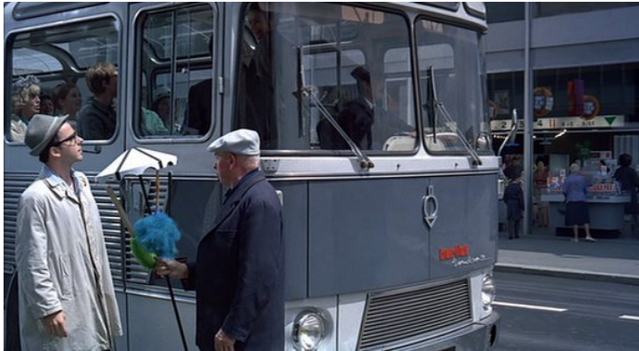
Abb. 7: Das Bürstenkarussell in PLAYTIME (1:59:04)

plötzlich eine ganz andere Bedeutung als in der ersten Einstellung des Films. War es dort noch Bestandteil des den Nicht-Ort resümierenden Wortes NO, so erscheint es nun über dem Kopf eines Geistlichen als Heiligenschein, der auch der vorher so unwirtlichen Bar einen gewissen Nimbus verleiht (Abb. 5). Und sogar auf der Straße kommen nach Tagesanbruch Drehungen ins Bild. Vom Bus aus erblickt Barbara eine rotierende Kugel am Büro einer Luftfahrtgesellschaft, wo am Vortag nur das lineare Hin und Her eines Bürostuhls zu sehen war (Abb. 6). Und beim Einsteigen in den Bus taucht kurz ein Bürstenverkäufer auf, dessen Waren an einem Regenschirm baumeln wie Menschen an einem Karussell (Abb. 7).