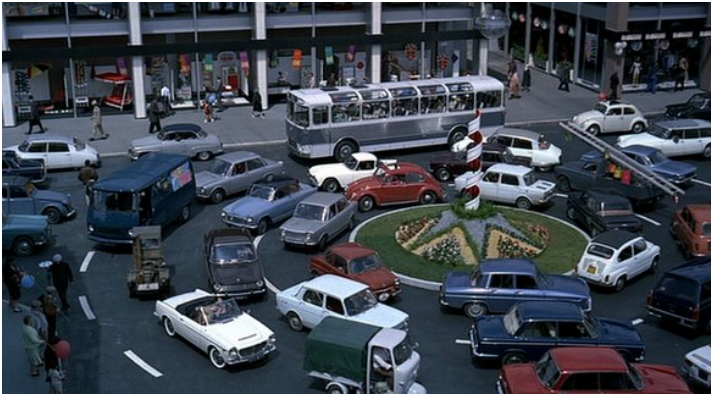
Abb. 8: Das Kreisverkehrskarussell in PLAYTIME (1:59:55)

gilt 32 . Die von seinem „carrefour à giration“ angestoßene Entwicklung gipfelte im Autobahnbau, und in der Tat gleichen Kreisverkehre weniger einer Straßenkreuzung als einem Autobahnkreuz, da sich die direkte Interaktion zwischen den Verkehrsteilnehmern auf ein Minimum reduziert 33 . Statt an anderen Fahrern fährt man an einer leeren Fläche vorbei, die zwecks Vermeidung eines urbanen horror vacui oftmals mit sogenannter Kreiselkunst ausgestattet wird. So gesehen, könnte man auch den Verkehrskreisel in „Tatville“ als ein weiteres Emblem der Entfremdung und Vereinsamung deuten 34 . Dagegen spricht jedoch, dass er in Tatis Darstellung wie ein gigantisches Karussell aussieht (Abb. 8). Denn anders als die übrigen Straßen des Viertels wird er von sehr unterschiedlichen, größtenteils bunten Vehikeln befahren, die obendrein keine Neigung zum Abbiegen zeigen und teilweise zugleich eine vertikale Pendelbewegung vollführen. Diesen Eindruck erzeugt und verstärkt ein raffiniertes Zusammenspiel szenographischer und kinematographischer Effekte. Das karussellartige Auf und Ab mancher Fahr-