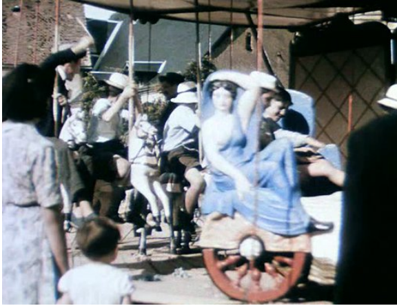
Abb. 10: Das Karussell neben dem Kino in JOUR DE FÊTE (33:57)

schreiben lassen 37 . Auf solchen Rummelplätzen aber ist ursprünglich auch das Kino zuhause. An diese unfeine Herkunft erinnert nicht nur Tatis erster abendfüllender Film JOUR DE FÊTE (1947), wo Lichtspielzelt und Ringelspiel die beiden Hauptattraktionen eines Volksfestes bilden (Abb. 10) 38 . In der Kreiselsequenz leuchtet sie auch in PLAYTIME auf. Durch die Inszenierung des Kreisverkehrs als Karussell werden beide als ‚kinematographische Objekte‘ kenntlich, als ikonische Zeichen der Filmrolle in Kamera und Projektor 39 . Mit diesen Apparaten vollendet Tati, was Monsieur Hulot als Rotlichtbringer und Vandale wider Willen beginnt: die Rückverwandlung einer abstrakten Zone in einen konkreten Ort. Statt wie in MON ONCLE einem hypermodernen Paris eine unverwechselbare Altstadt gegenüberzustellen, versetzt er in PLAYTIME den urbanen Nicht-Ort schlechthin in eine Bewegung, die seine Gesichtslosigkeit ins Gegenteil verkehrt.