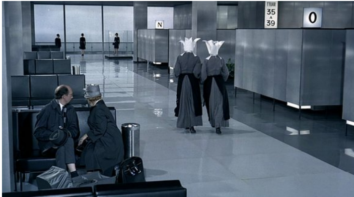
Abb. 2: Negierte Ortsspezifik in PLAYTIME (03:19)

den Schwwestern, dann eine Krankenschwester mit Baby vorbei, während eine Dame ihrem Gatten medizinische Ratschläge erteilt. Sogar der Zuschauer wird mithin zum Opfer einer Verwechslung, die auf dem hohen Abstraktionsgrad des Raumes beruht. Was in der französischen Boulevardkomödie nur bestimmten Bühnenfiguren passiert, die etwa ein Hutgeschäft für ein Standesamt halten 21 , greift hier kraft radikaler Auslöschung aller Lokalität auf den ganzen Kinosaal über. Erst als hinter einer Fensterfront ein Flugzeug und schließlich an der Glasfassade der Schriftzug „AÉROPORT DE PARIS“ erscheint, lässt sich die Szenerie eindeutig in Orly ansiedeln.