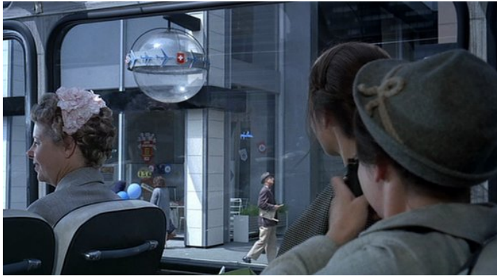
Abb. 6: Das Flugverkehrskarussell in PLAYTIME (1:59:20)

Parallel zu Hulots optischen und haptischen Manipulationen verleiht auch Tatis filmische Inszenierung dem Nicht-Ort ein anderes Gesicht. In der zweiten Hälfte des Films folgt sie der Formel „vom Eckigen zum Runden“ 29 . Schon in der langen Restaurant-Sequenz zeichnet sich mit zunehmender Erhitzung der anfangs sehr kühlen Atmosphäre eine Veränderung der Bewegungen ab. Als die hinter der eingestürzten Verblendung spielenden Gäste auch die musikalische Abendgestaltung übernehmen, weicht auf der Tanzfläche der hektische, an geraden Linien ausgerichtete Jazztanz einer runderen Choreographie – bis hin zum langsamen Walzer, den ein spontan intoniertes Pariser Chanson begleitet. Tatis generelle Beobachtung, dass man sich unter Unbekannten auf rechtwinkligen Bahnen bewege, unter Bekannten dagegen Kurven beschreibe 30 , gewinnt hier offenkundig szenische Geltung. Der Umschlag ins Zirkuläre bleibt jedoch keineswegs auf den nächtlichen „Royal Garden“ beschränkt. Auch vor der zerborstenen und nur noch vorgespiegelten Glastür kommt eine Drehbewegung in Gang, als ein betrunkenen Nachtschwärmer seine Schritte an dem spiralförmigen Neonpfeil über dem Eingang ausrichtet. Nach der durchtanzten Nacht hat sich die Kreisform schließlich ganz nach draußen verlagert. Im „Drugstore“, wo sich Hulot und seine Tanzpartnerin Barbara mit den am Stegreifspiel beteiligten Gästen zum Frühstück versammeln, gewinnt das O des Schriftzuges