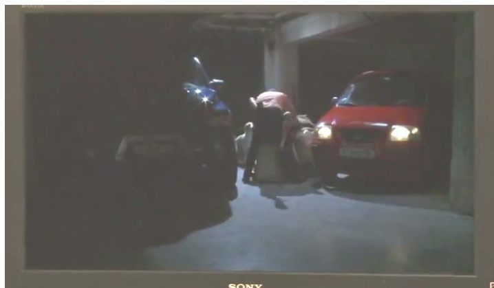
Fig. 5: La escena de violación de Ginette por el diplomático europeo

moral de tal afirmación, es posible constatar en el transcurso de la trama un movimiento asintótico entre Ana y Ginette: la inicial incomodidad y torpeza en su rol va cediendo a una identificación cada vez más fuerte de Ana con Ginette (sobre todo en la primera entrevista y luego en las filmaciones de Ginette para los europeos) hasta un proceso de identificación inverso: el de Ginette con Ana – que se va transformando en directora de la historia de su vida. 19 De esta forma la película no sólo pone en escena la relación de similitud entre ficción y realidad, sino que también desde una perspectiva de género implica un cambio de la posición de “objeto” a la de “sujeto”.