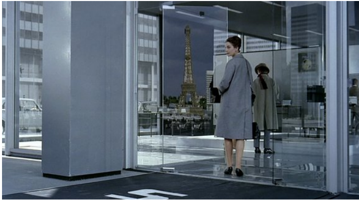
Abb. 3: Virtuelles Lokalkolorit in PLAYTIME (32:36)

Farblosigkeit. Überall dominieren Grautöne oder kalte Farben, ähnlich wie in den gleichzeitig entstandenen Kriminalfilmen Jean-Pierre Melvilles. Sogar die knallbunten Desserts, die im örtlichen „Drugstore“ angeboten werden, sehen im giftgrünen Licht einer benachbarten Apotheke fahl und befremdlich aus. Umso mehr erregt ein vereinzelter Blumenstand Barbaras Aufmerksamkeit, neben den moosgrünen Linienbussen der einzige Außenposten des alten Paris. Allerdings will es ihr auch hier nicht gelingen, ein charakteristisches Erinnerungsphoto zu schießen, da ständig Amerikaner oder Japaner am Bildrand erscheinen. Zur Farblosigkeit des Viertels kommt zweitens seine Profillosigkeit. Vor allem im Innern der Gebäude sind alle Oberflächen so glatt, dass man nirgends Halt zu finden vermag. Als Hulot nach seiner Ankunft im Linienbus auf der Suche nach einem gewissen Giffard ein Bürohaus betritt, verliert er auf dem Linoleumboden gleich mehrfach das Gleichgewicht, selbst wenn er sich auf seinen legendären Stockschilder stützt. Zu seiner Verlorenheit in diesem Ambiente trägt drittens die Serialität der betretenen Räume entscheidend bei. So wie er auf dem Parkplatz vor dem Bürogebäude zwei Reihen gleicher Autos durchquert, so trifft er drinnen auf eine ganze Etage voll identischer Arbeitsboxen, deren schiere Menge die Orientierung erschwert. Außerdem findet er die überall gleichen Türen und