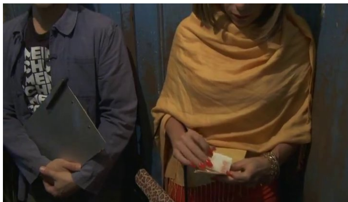
Fig. 2: Ana/Ginette contando su dinero después del “acto” de filmación

Con la tematización del jineterismo en el primer plano de la película –que coincide con el foco de interés de los directores europeos– Díaz Torres pone en escena uno de los temas candentes y discutidos en la sociedad cubana: los modos de supervivencia en las condiciones de escasez del período especial, que conlleva a la vez amplias consecuencias para el imaginario postcolonial de la isla y la relación entre cubanos y extranjeros. Posiblemente sea por esto que la película está ambientada mediante un insert (“La Habana, 200...”) unos años antes del de su producción, 2012, en los primeros años del siglo XXI, es decir en las inmediaciones del período especial. La película muestra también, aunque solo de paso, las intervenciones y medidas estatales frente al jineterismo (que sin prohibirlo directamente sí lo sancionan y lo condenan); así según Alcázar Campos,