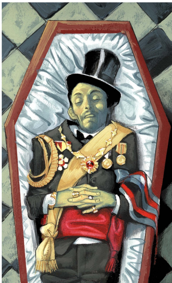
Portada de AJUAR FUNERARIO (2004)